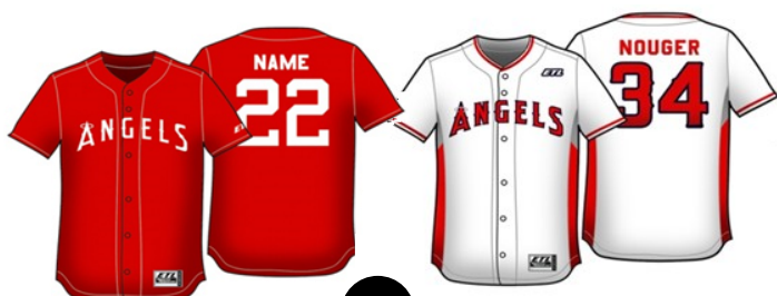
Maillot Angels sublimé